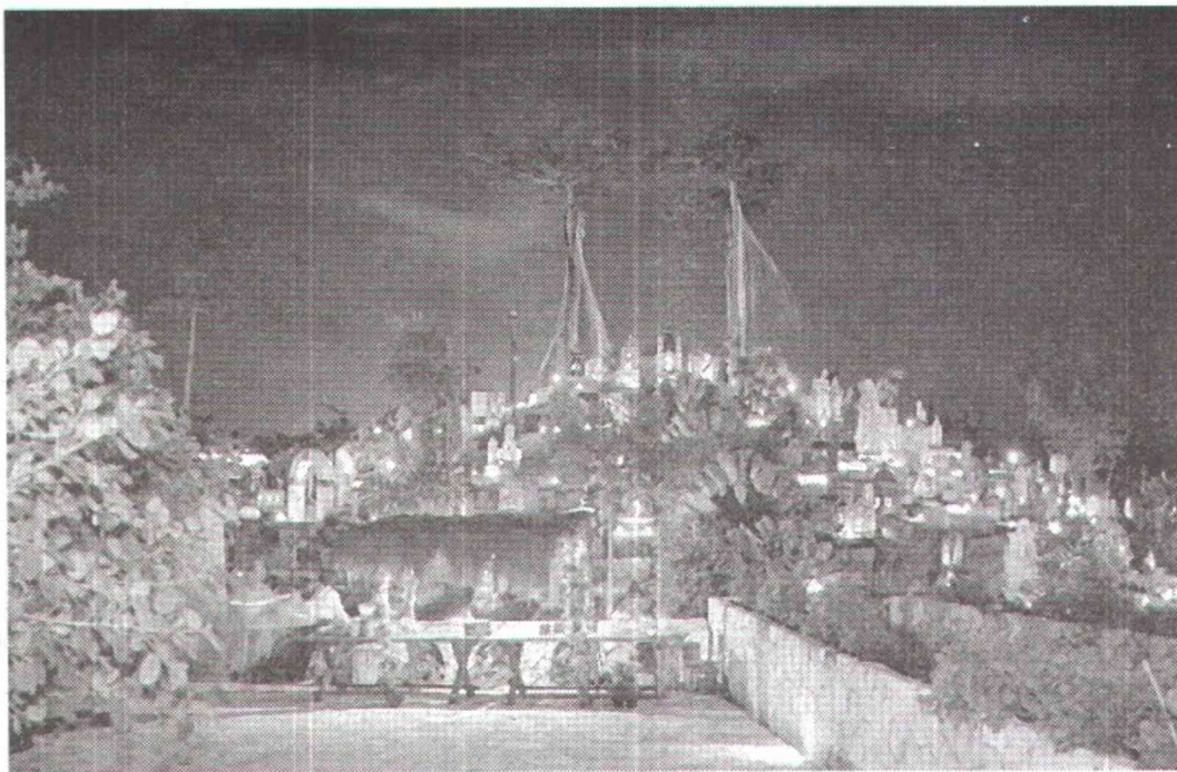
Este año estará representado el estado de Chiapas.