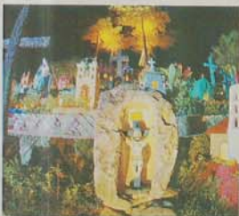
UNA OF. Los locales adornan los altares que decoran el parque.

Durante cuatro días a partir de las 10 horas y hasta las 23 horas podrá ser escuchado los abuelos mayas como leyenda, pero a las comunidades locales ofrendas con cuidado especial, imitando el ambiente con incienso y copal.