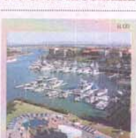
Marina del hotel