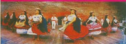
Algunas presentaciones se realizarán en el foro al aire libre localizado a la salida de un río subterráneo.

Este año se estrenará la obra La danza de las ánimas que, además, será el tema principal del festival, compuesta por el maestro Andrés Campos. La interpretación estará a cargo de la Orquesta Sinfónica Juvenil de Yucatán.