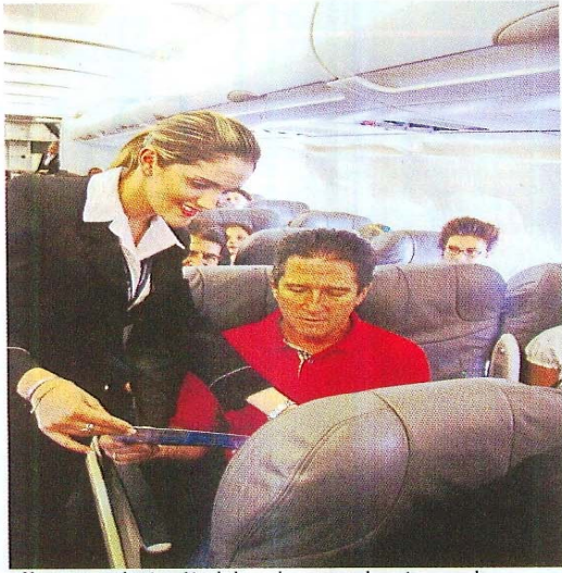
No apapace la atención de las sobrecargos durante un vuelo.